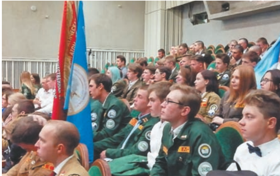
фото: Анастасия Овчаренко (3)

Еще до начала концерта полный зал напевал