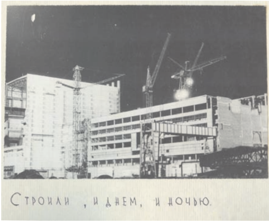
фото из юбилейного фотоальбома СМУ-1