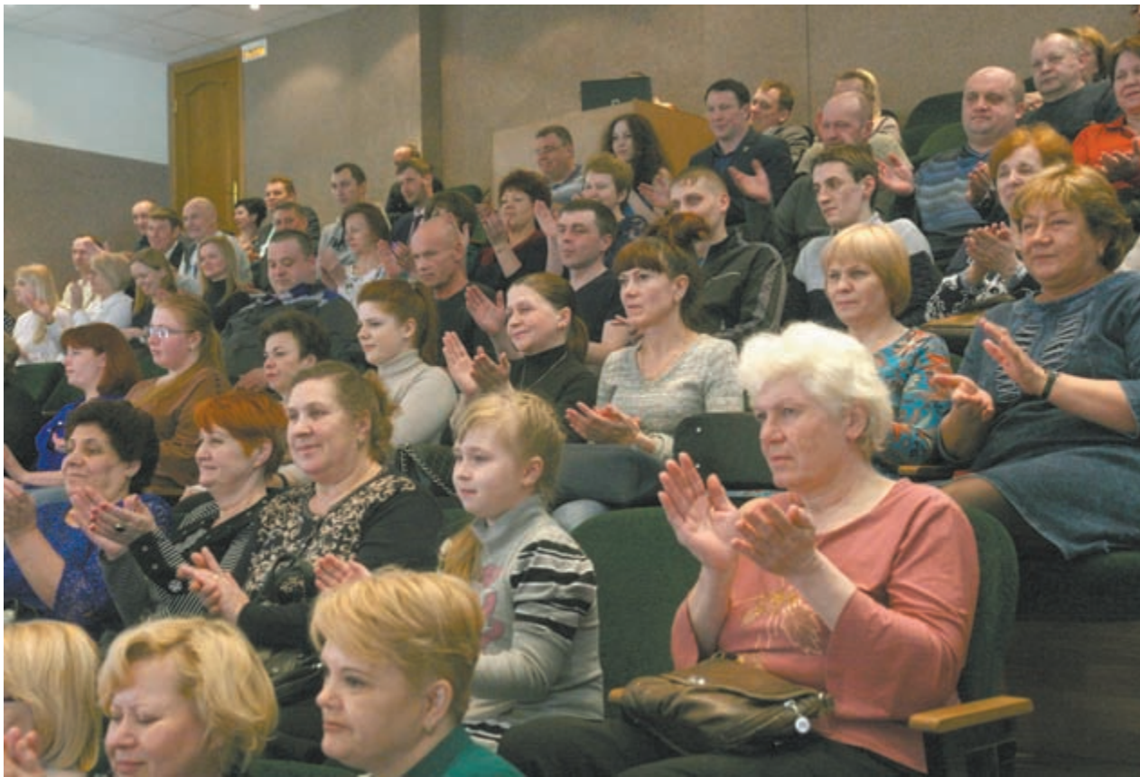
В зале собрались работники коммунальной сферы Соснового Бора