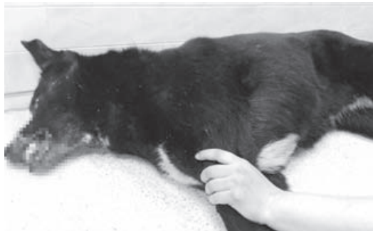
Съев отраву, животное погибает в мучениях