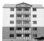
ЖК «Солнце»: Строительство должно завершиться в сентябре.

Почтовый адрес приемной: 188540, г. Сосновый Бор Лен. обл., ул. Ленинградская, 46, кабинет № 329. Электронная почта: Kirilenko@meria.sbor.ru Телефон приемной: 8(813) 696 - 28 - 77. Приемные дни: вторник, среда с 9.00 до 18.00 перерыв: с 13.00 до 14.00