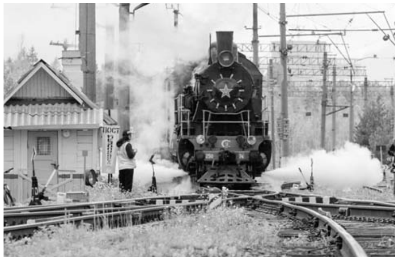
фото: Степан Савенко