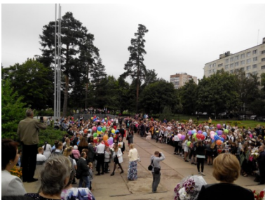
Первое сентября 2018 года

2016 г. - была основана новая школьная газета "БЕЛКА", первый номер вышел 6 октября. Ученики гимназии победили в областном туре Президентских спортивных игр