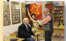
День Победы в музее

2011-2013 гг. - победитель в областном туре Президентских спортивных игр