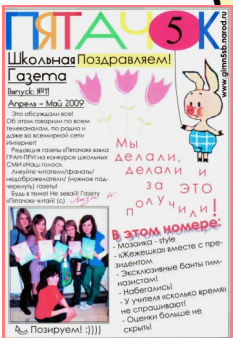
Шедевр журналистского мастерства!