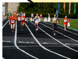
Быстрее, выше, сильнее

2014 г. - победитель смотра-конкурса на лучшую образовательную организацию, развивающую физическую культуру и спорт