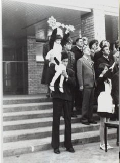
Первый звонок 1980 год

Гимназия 2007 г. - выиграла грант президента Российской Федерации