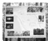
Идея экотропы реализуется и в других уголках Соснового Бора. Например, в Приморском парке

Теперь самое главное — сохранить все хорошие изменения, поддержать начинания и не допустить, чтобы что-то было разрушено неосознательными отдыхающими. Быть может, пример создания экологического проекта возьмут на вооружение другие сосновоборцы, и в городе появятся экополяны, экодворики и новые экотропы.