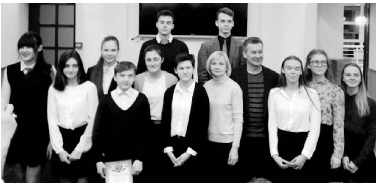
Старшеклассников чествовали в здании администрации

Для некоторых из сосновоборцев это уже третья поездка в Сочи на центральный фестиваль, многих редакторы помнят в лицо. Но поблажек не делают: нет хороших шуток — нет шансов на победу. И надо очень постараться! Зная ребят, верится, что они сумеют себя показать. И это без шуток.