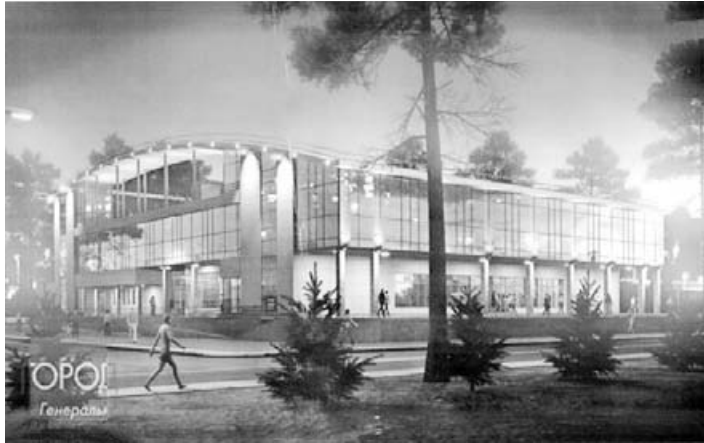
Таким видят здание «Эвридики» новые инвесторы

На недавнем заседании комиссии по распоряжению муниципальным имуществом под председательством главы Владимира Садовского решали — идти