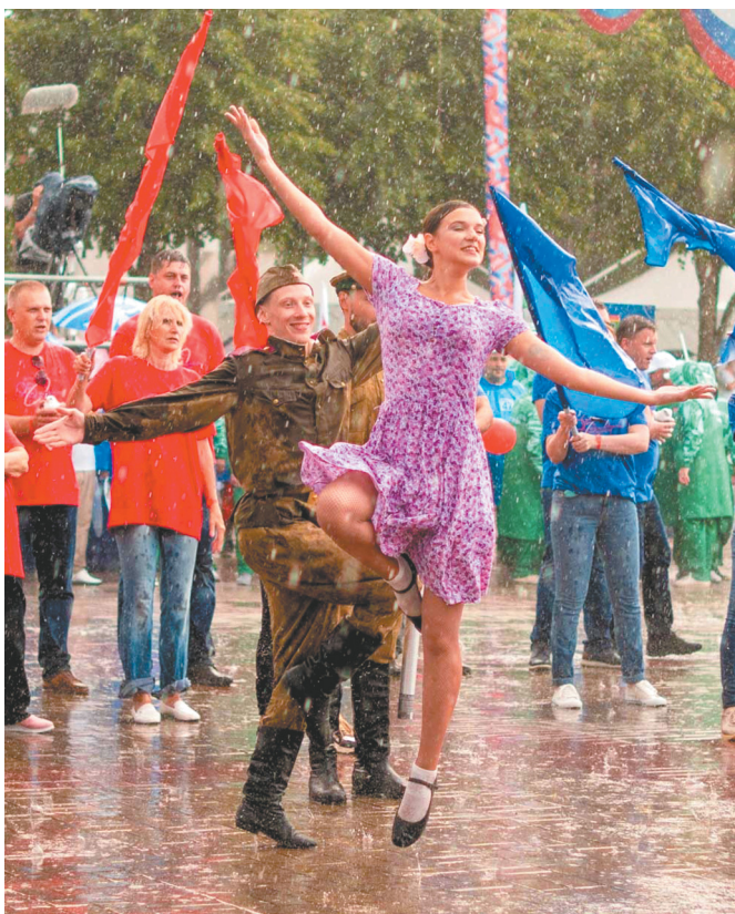
Праздник продолжался несмотря на ливень