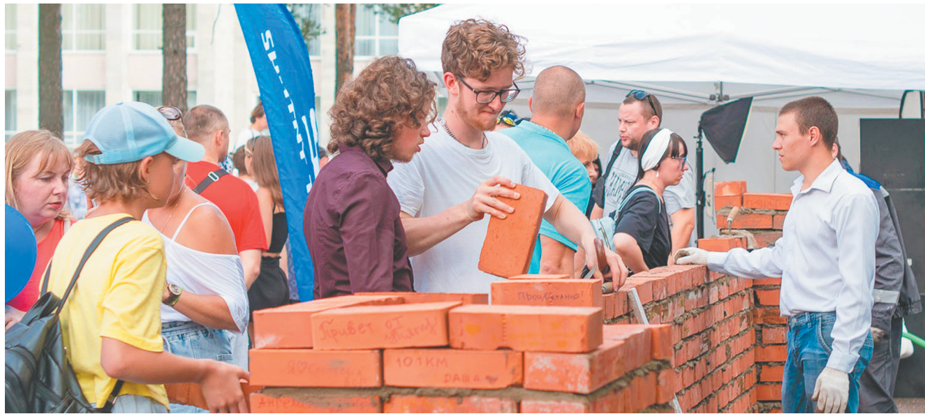
Центральной частью праздника стала стена из кирпича, построенная прямо на площадке

Гостей праздника ждали несколько фотозон: от привычной фотобудки до фото-спиннера, который сделал живые фотографии с обзором в 360 градусов. Поиграть в строителя можно было в специальной зоне со строительной техникой. В этот раз вместо уже любимых радиуправляемых моделей титановцы установили модели побольше — с сиденьями и пультами управления, почти как на настоящем подъемном кране или экскаваторе.