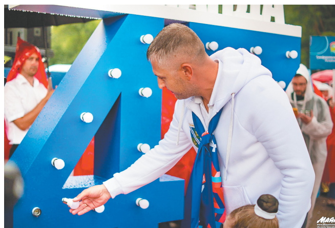
Глава Соснового Бора тоже вкрутил свою лампочку в стоящий перед сценой щит «энергии 47 региона»

Каждая делегация шла под своим флагом и представляла одну из энергий,