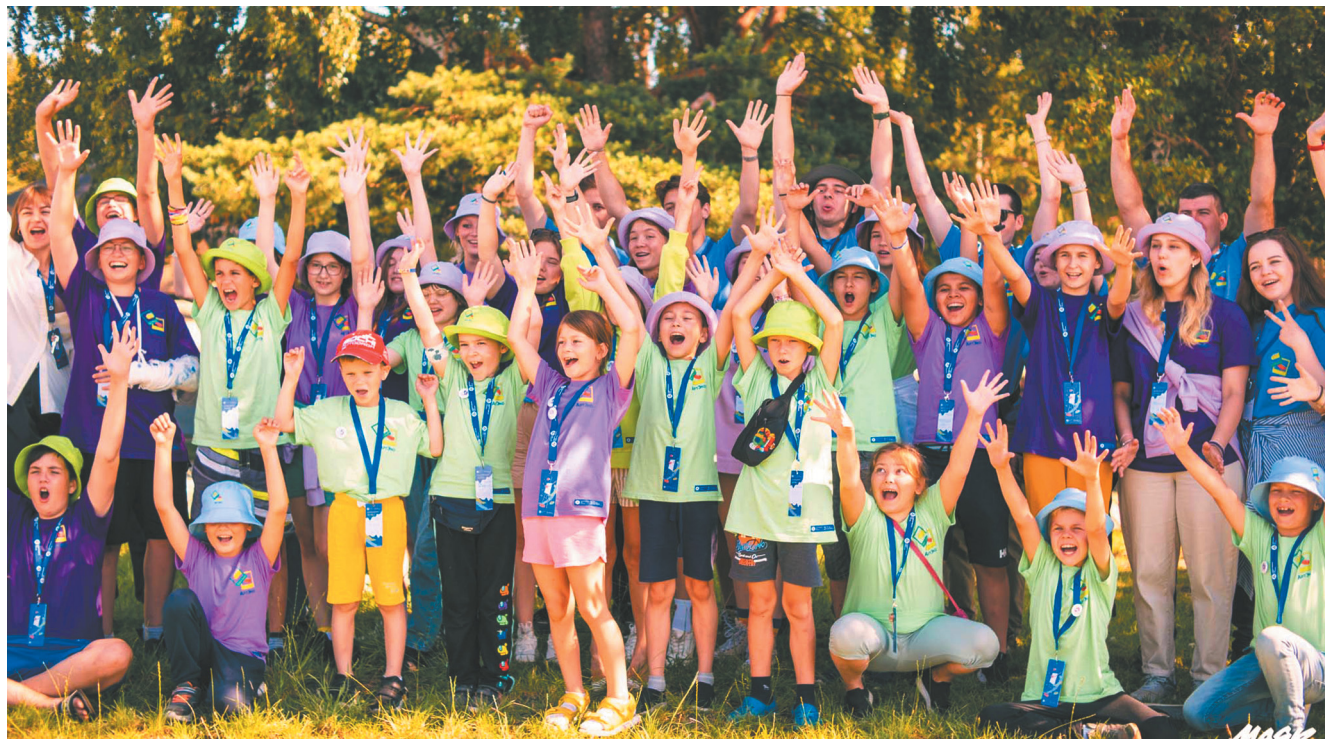
Фото: Людмила Цупко (3)