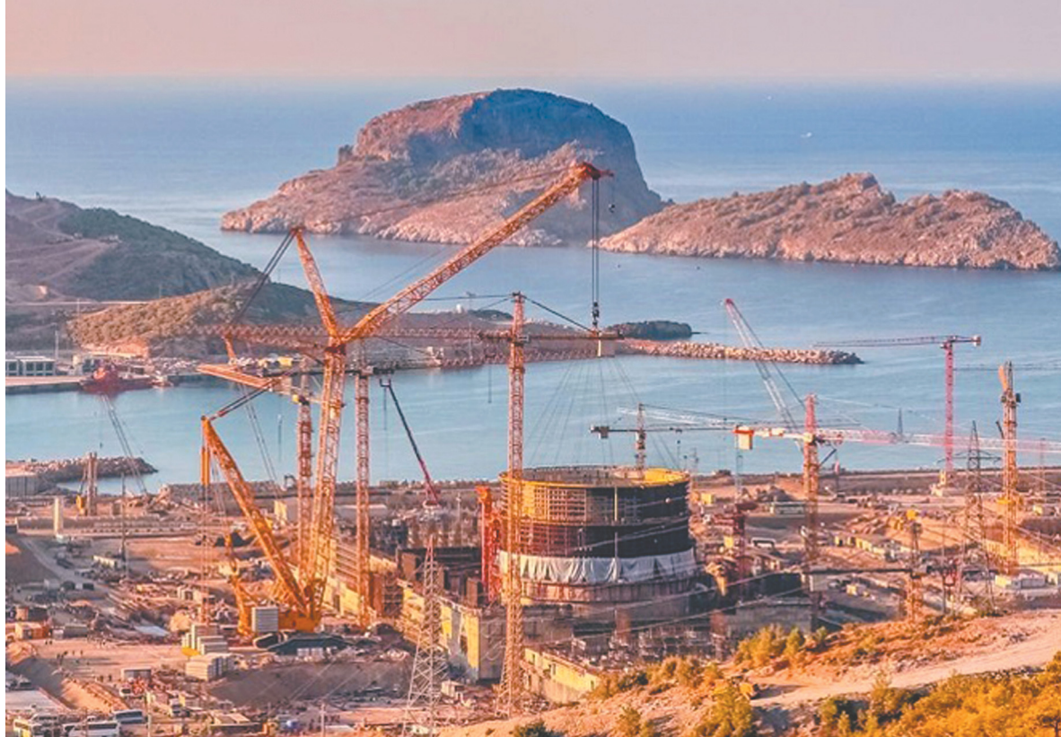
На площадке строительства АЭС ежедневно трудятся более 13 тысяч человек, задействовано более 1000 единиц строительной техники и автотранспорта, в том числе свыше 70 строительных кранов

До получения лицензии на строительство на участке сооружения блока № 4, на основании ограниченного разрешения на строительство от 30 июня 2021 года, велась работа по подготовительному этапу — инженерные изыскания и устройство котлована. До конца теку-