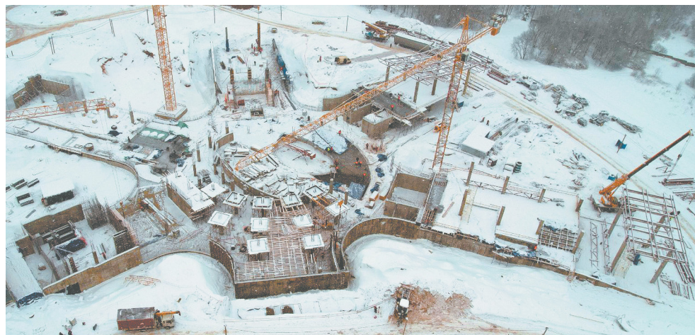
Агора расправляет лепестки

Внутри построенных корпусов тепло. В вестибюлях первых этажей мирно, на одной ноте, гудят теплогенераторы. Котельная специально построена для Центра «Сенеж», и в ней ведутся пусконаладочные работы. К корпусам подведены