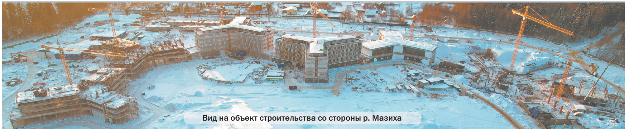
Вид на объект строительства со стороны р. Мазиха