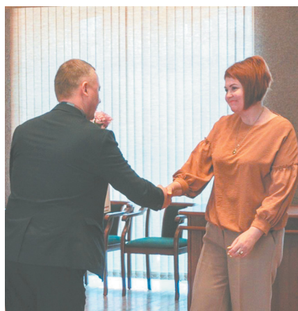
Представители администрации и депутатского корпуса вручают работникам ЖКХ благодарности от губернатора и правительства Ленинградской области

ЖКХ Sosnovy Bor преобразился и вернул почти утерянную когда-то славу