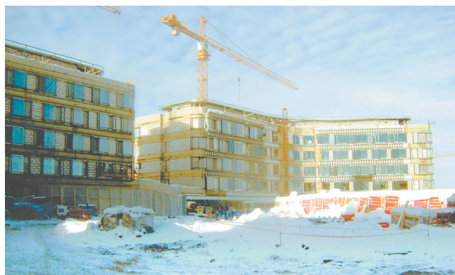
Фасады гостиничных корпусов

водопроводы, и по временной схеме на этажи уже подается тепло.