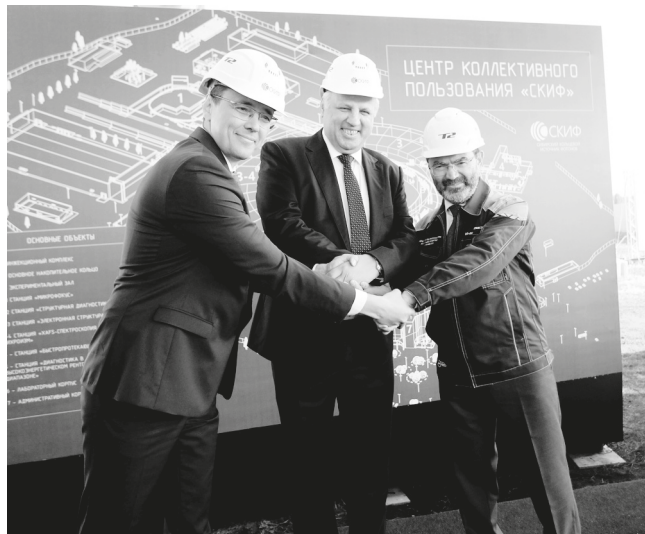
СКИФ, начало стройке положено