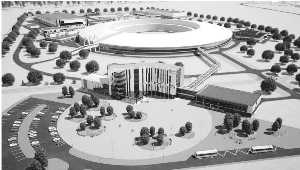
Общий вид на объект ЦКП «СКИФ», подготовлен АО «ЦПТИ»

Сибирский кольцевой источник фотонов (СКИФ) представляет собой один из крупнейших в России за последние десятилетия проектов в области научно-исследовательской инфраструктуры. Проект ЦКП «СКИФ» представлен более чем на двадцати международных и российских конференциях, форумах и научных сессиях, и признан лучшим среди проектов источников синхротронного излучения с энергией 3 ГэВ.