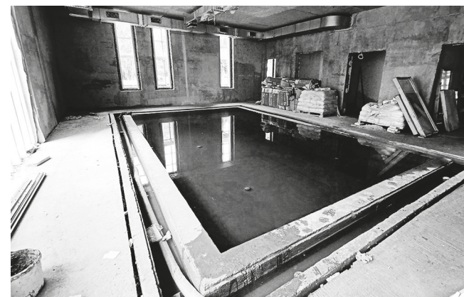
Уже сейчас можно посмотреть на бассейн, который проходит гидроиспытания

Впервые журналистов пускают внутрь строящегося здания. Сейчас оно еще мало похоже