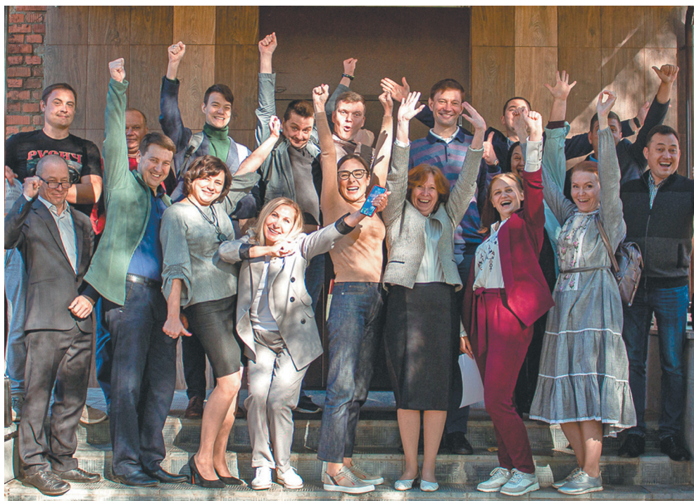
Участники акселератора социальных проектов 2020 год в городе Глазов

В первые три года заданием для школьников было снять видео-интервью или видео-историю о людях, которые строили, поднимали, развивали атомные предприятия и их города-спутники. За это время организаторы получили более 14,5 тысяч видеороликов, а количество участников превысило 60 тысяч. В прошлом году аудио-визуальный жанр заменили эпистолярным — работ от этого стало только больше. На городском этапе ученики написали около 23,5 тысяч сочинений, а для участия в федеральном этапе было направлено почти 600 работ.