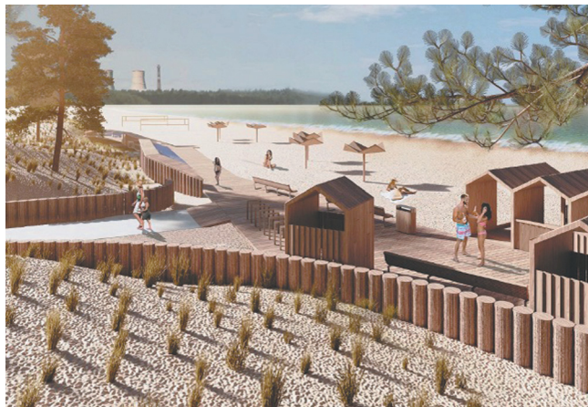
В проектных решениях использованы местные мотивы

Заказчиком проекта выступила Ассоциация «Граждане города Сосновый Бор» (проектная организация: ООО «М4», г. Москва). Уже начата подготовка к выполне-