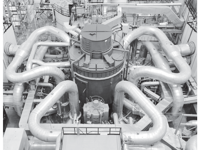
Реактор БН-800. Сегодня Россия — единственная страна, имеющая два реактора на быстрых нейтронах

Уникальность реактора поколения 3+, который сегодня является флагманским продуктом Росатома, еще и в соче-