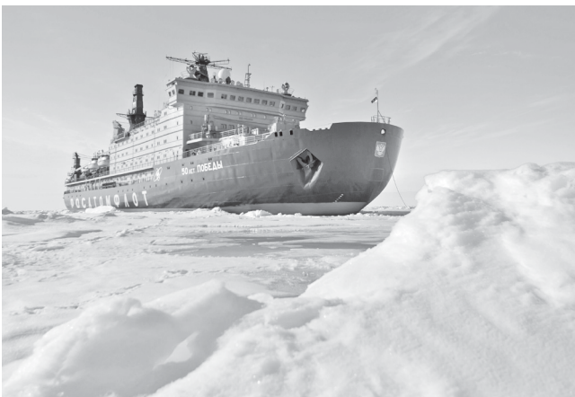
Ледокол «50 лет Победы» на Северном полюсе

С помощью мобильных энергоблоков малой и средней мощности можно решать проблемы энергоснабжения труднодоступных и отдаленных районов — и не только Крайнего Севера. Таких мест на планете очень много, строить стационарные АЭС там сложно, а обеспечивать энергопотребности за счет завоза органического топлива — и дорого, и небезопасно для окружающей среды. 700 тысяч тонн CO 2 — столько выбросов ежегодно предотвращает ПАТЭС. Мобильные атомные станции позволяют обеспечивать отдаленные районы светом