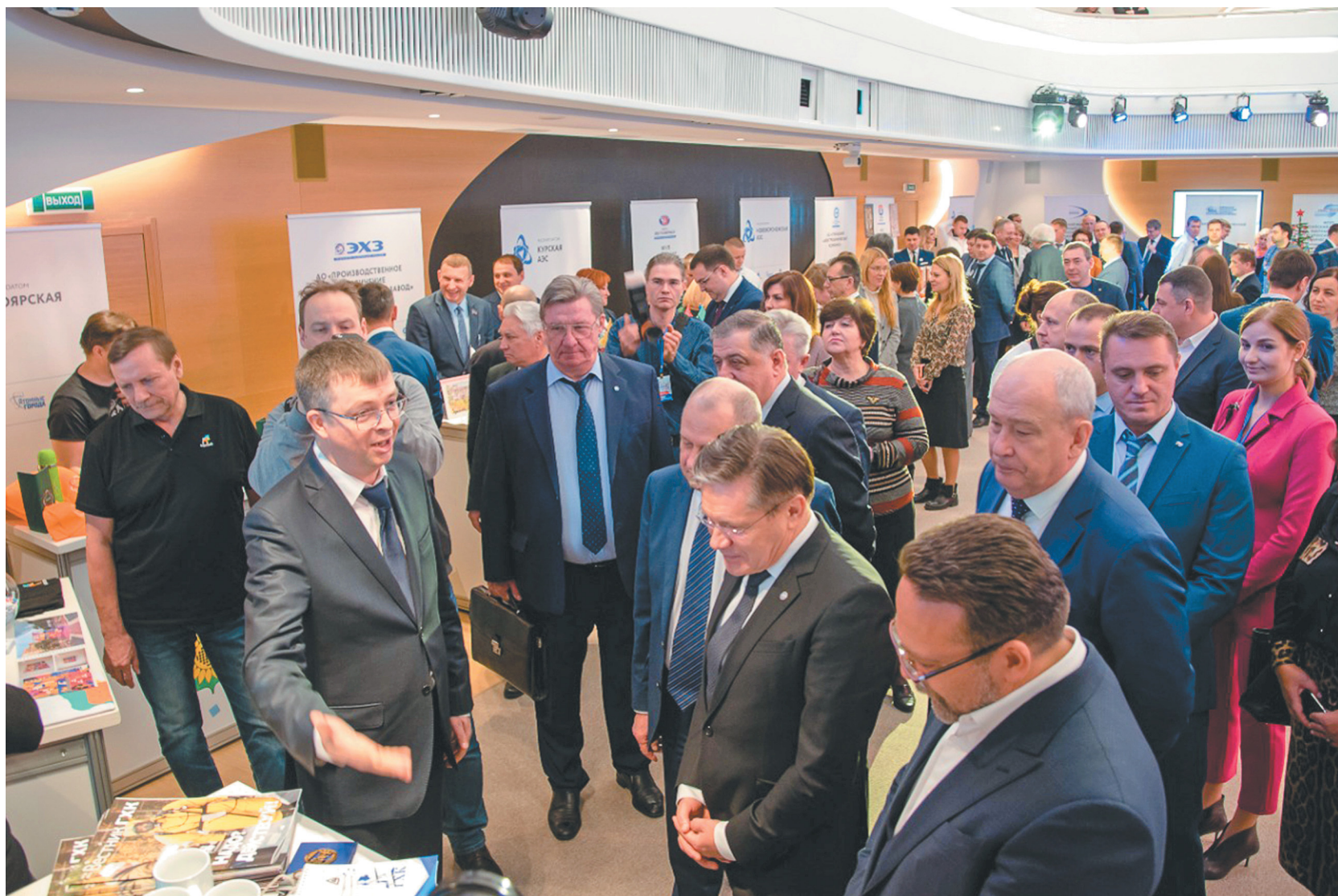
#РОСАТОМВМЕСТЕ — День Городов 2019

Соревнования координаторов проходят в рамках одного из самых масштабных и амбициозных проектов — #РОСАТОМВМЕСТЕ. Проект молодой, но уже заслуживший признание у специалистов. #РОСАТОМВМЕСТЕ был отмечен призом Национальной премии в области развития общественных связей «Серебряный Лучник»