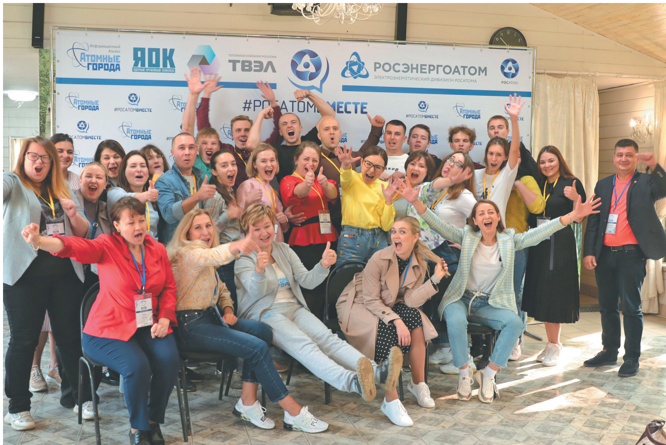
Молодежь и цифровизация — хакатон 2020