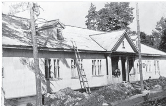
Строительство одного из барачков в поселке

Уже через четыре года в новом поселке выросла улица Ленинская. 1 мая 1962 года — идут ученики первой поселковой школы (позднее — вечерняя школа).