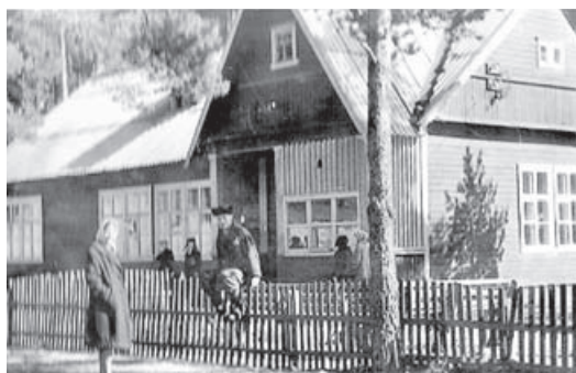
Временный поселок вырос среди сосен

(При подготовке использованы материалы книги Геннадия Алмазова «Река Времени»)