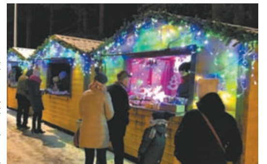
фото: Ирина Доронина (4)