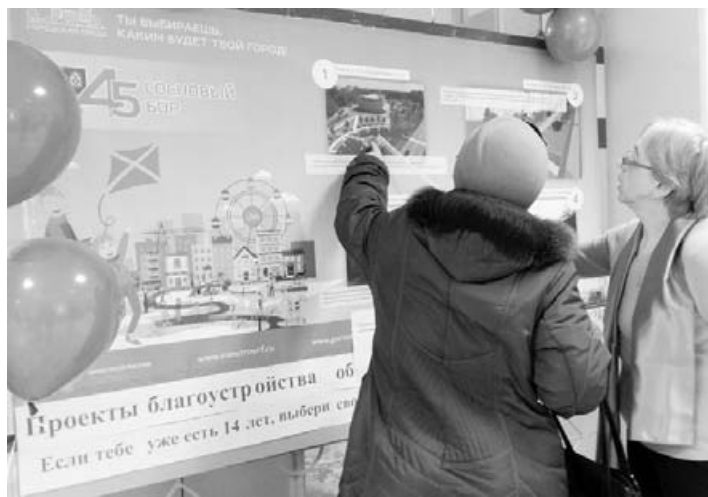
Жительница города знакомится с проектом «Комфортная городская среда»

изделия сосновоборских мастеров. В этот день каждый мог принять участие в судьбе благоустройства родного города и выбрать одну из общественно значимых территорий Соснового Бора, которую изменят уже в этом году. Горожане с интересом участвовали в рейтинговом опросе, а приятным сюрпризом стали памятные значки, изготовленные специально к 45-летию города. Участникам опроса дарили их на память за активную гражданскую позицию.