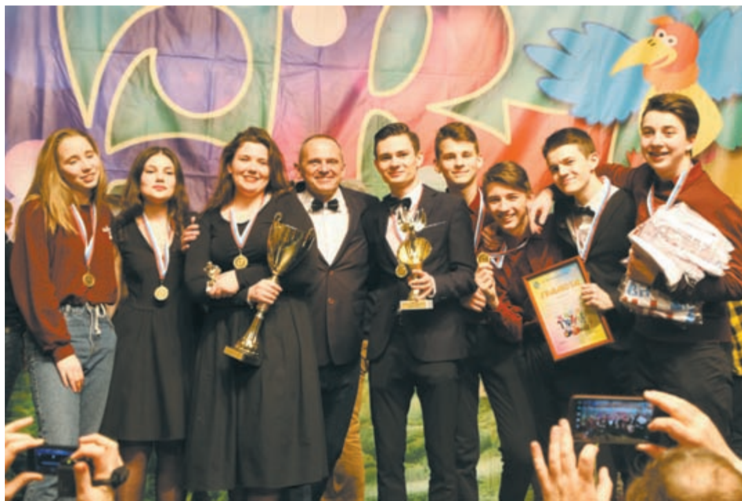
Новый достойный чемпион 20-го сезона: команда КВН «Дважды восемь» (лицей № 8)

Это была действительно великолепная финальная пятёрка! Команды школы № 2 — «Второй шанс», лицея № 8 — «Дважды восемь», школы № 7 — «Нон-стоп», гимназии № 5 — «5 баллов», политехнического колледжа — «Из-под крана» прошли через 4 конкурса. Два с половиной часа позитива, смеха, открытий, удивлений, «разрывов зала»! И новый достойный чемпион 20-го сезона: команда КВН «Дважды восемь» (лицей № 8). Буквально на днях в молодежном центре «Диалог» появится звезда на нашей КВНовской аллее Славы в честь нового чемпиона!