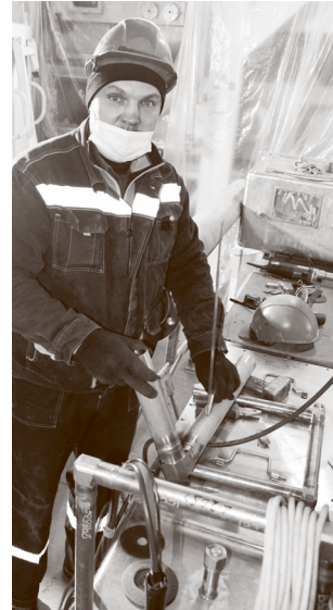
С точностью до градуса...

Оборудование изготовлено ООО НПФ «Сосны» (г. Димитровград) в сотрудничестве с французской фирмой «Champalle SAS». За его поставку и сопровождение монтажа отвечало АО «СвердНИИхиммаш».