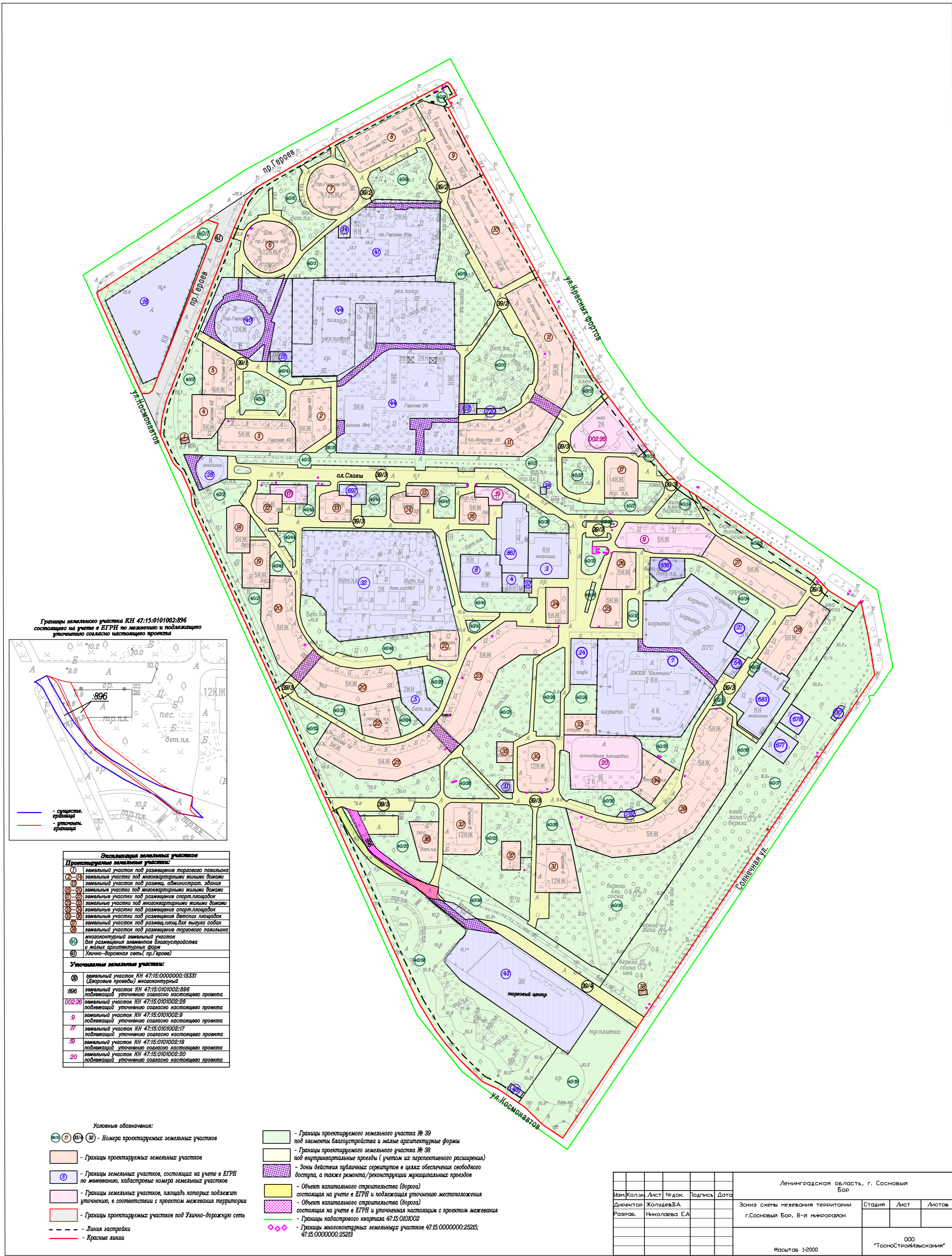
Границы земельного участка КИ 47:15:0101002:396 остоющего на учете в ЕГРН по изменению и подлежащего уточнению согласно настоящему проекту