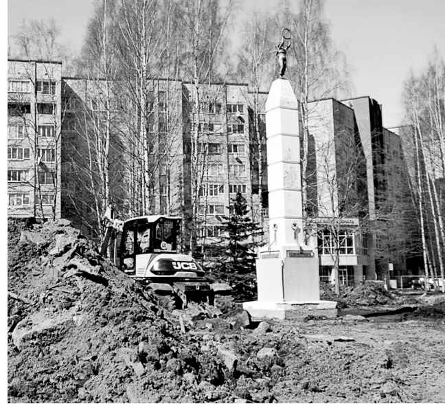
Сейчас подрядчик СК «ГиК» занимается строительством дренажно-ливневой канализации и работает даже с опережением графика

Ныне это место на прогулочную зону не похоже совсем: кругом ямы, траншеи и горы вынутаго грунта. Сейчас подрядчик