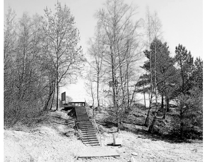
Вместо узкой крутой лесенки будет широкая и более пологая лестница как минимум в два раза шире уже существующей

Согласно проекту, путь к заливу станет удобнее для всех. На пляж будет сразу несколько входов: помимо выхода самой велодорожки к дороге, будет обустроен спуск для маломобильных граждан, выходящий на ве-