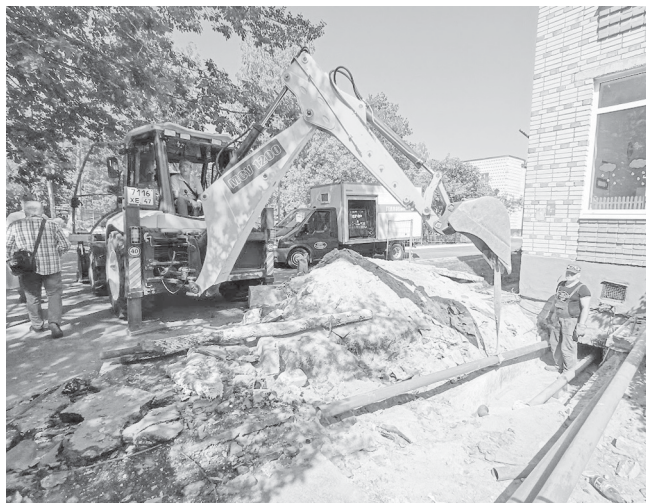
фото: Людмила Цупко (3)

Летом образовательные учреждения вступают в активную пору ремонтов. Сейчас плановые работы продолжают в нескольких школах и детских садах города — некоторые приводят в порядок помещения к осеннему возвращению детей, некоторые расширяют свои мощности для приема новых воспитанников.