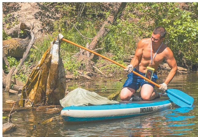
фото: Людмила Цупко (2)

Утренний сбор желающих присоединиться к субботнику был объявлен у базы отдыха «Хеваа» у городского пирса. Именно туда прибыли любители водных видов спорта из клуба «Формула воды» и сотрудники Ленинградской АЭС. На воду вышли около двух десятков человек на разнокалиберных плавсредствах: сапах (досках для серфинга, на которых можно стоять и гребти веслом), байдарках, катамаранах и полноценных лодках (их одолжила для субботника база «Хеваа»). Мусор собирали и с берега: этим занялись члены молодежной организации ЛАЭС