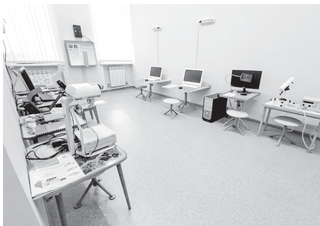
Открылся уникальный, единственный в Ленинградской области кабинет охраны зрения для дошкольников, который функционирует прямо в здании детского сада № 12.