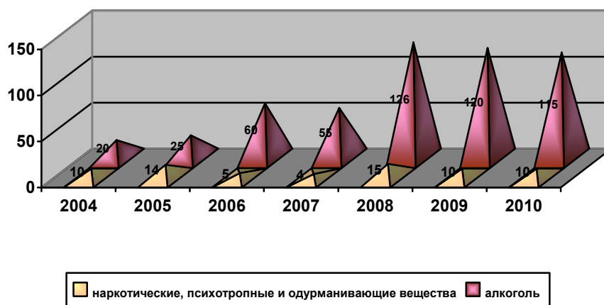
Диаграмма 2. Количество несовершеннолетних, задержанных за употребление спиртных напитков; наркотических, психотропных и одурманивающих средств в Сосновоборском городском округе (2004-2010 г.г.)

Опыт других регионов РФ показывает, что объем усилий, необходимых для реабилитации семьи, растет обратно пропорционально стадиям кризиса семьи: чем раньше будет оказана помощь семье, тем меньше усилий на это потребуются. Главным и приоритетным направлением работы субъектов системы профилактики Сосновоборского городского округа является работа по обеспечению единого подхода к решению проблем профилактики безнадзорности и правонарушений несовершеннолетних, проведению комплекса мероприятий по преодолению дезадаптации детей и подростков, отличающихся устойчивым и противоправным поведением, принятию мер по своевременному выявлению и оказанию различной помощи и поддержки несовершеннолетним и их семьям, оказавшимся в трудной жизненной ситуации. В последние годы наблюдается незначительное снижение числа несовершеннолетних, задержанных за употребление спиртных напитков и состоящих на учете у нарколога, но при этом количество несовершеннолетних, употребляющих ПАВ (психо-активные вещества), по сравнению с 2005-2007 годами выросло почти в 2,5 раза, в связи с этим данная проблема является одной из приоритетных для рассмотрения и принятия мер по профилактике употребления ПАВ.