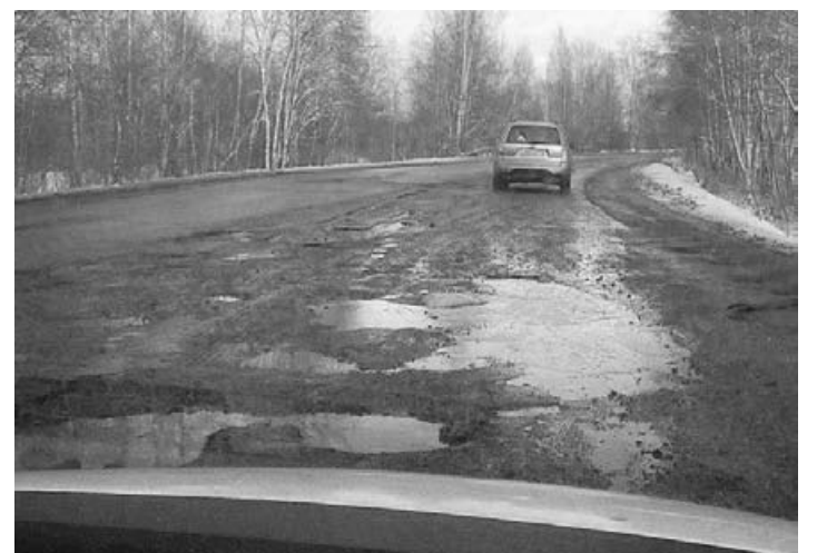
Дорога в Санкт-Петербурге в районе деревни Коваши

К сожалению, адресный список и точные даты начала ремонта сосновоборских дорог администрация города пока не назвала.