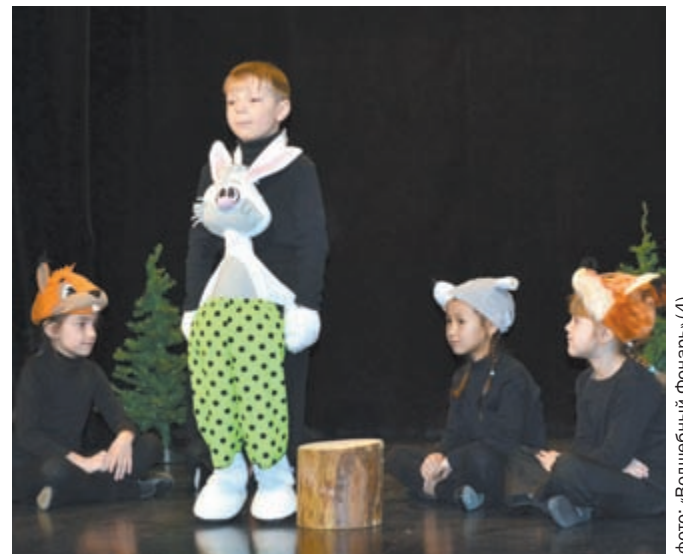
фото: «Волшебный фонарь» (4)