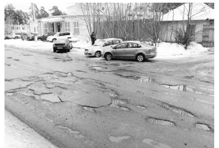
Дорога возле городской бани

Более масштабные работы развернутся на проез-