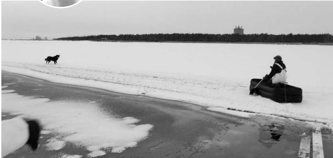
Спасательная операция длилась около трех часов

— Я не герой, серьезно, это просто выбор совести. Это не я, любой мог помочь собаке. У меня просто опыт есть, вот и всё. Все находившиеся на пирсе собирались за собакой.