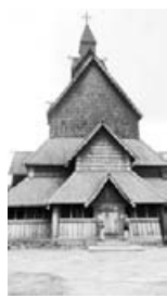
Ставкирка (храм) XVI вехи. Деревянное зодчество есть не только на Русском Севере

Санкт-Петербург — Хельсинки — Стокгольм — Осло — Люсефьорд — Берген — Гейрангер