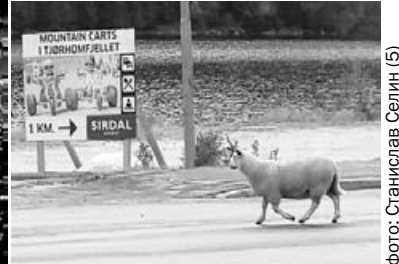
фото: Станислав Селин (5)