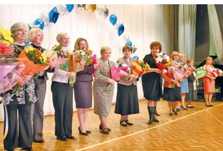
На сцене — руководители школ и учреждений дополнительного образования