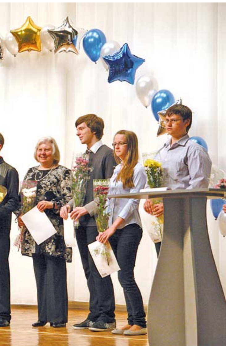
▲ Победители в точных науках: в физике, информатике, астрономии, экономике, основам предпринимательской деятельности и королеве наук математике