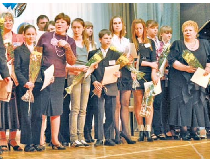
В музыке, черчении, изобразительном искусстве, технологии сосновоборцы достигли больших успехов