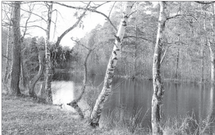
Главная задача — при благоустройстве максимально сохранить природу

В повестку очередного заседания Общественной палаты Соснового Бора Глуховка тоже попала не впервые. В этот раз обсуждали экологическое состояние, рекреационные мероприятия и тему планировки территории Приморского парка.