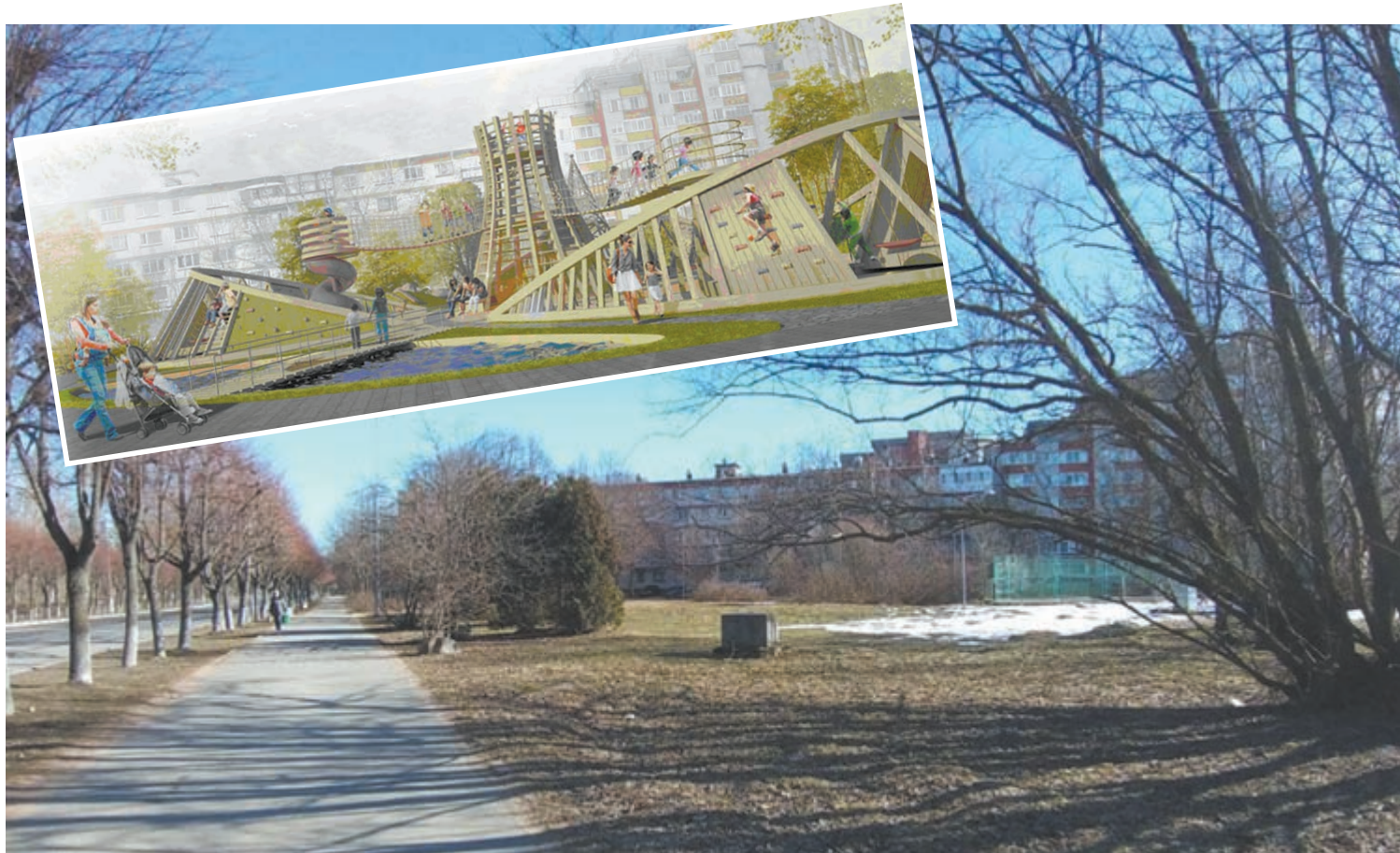
Участвовавший в голосовании эскиз проекта благоустройства Солнечной в итоге сильно изменится