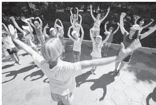
у 92 % детей, отдохнувших в сосновоборских городских лагерях в 2018 году, отметили выраженный оздоровительный эффект