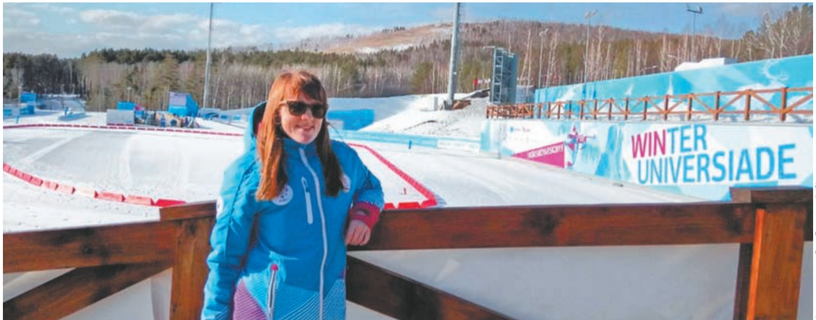
фото из архива Яны Логуновой (2)

— Подготовка длилась около года, — рассказывает Яна. — Я прошла несколько тестирований: на знания об универсиаде и о Красноярске, по английскому язы-