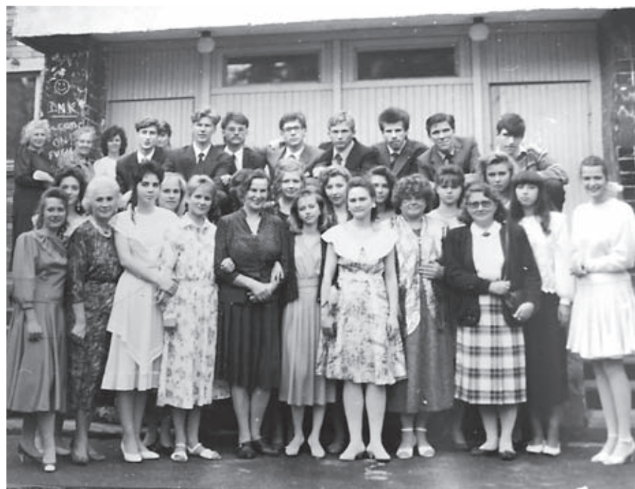
фото из архива частной школы