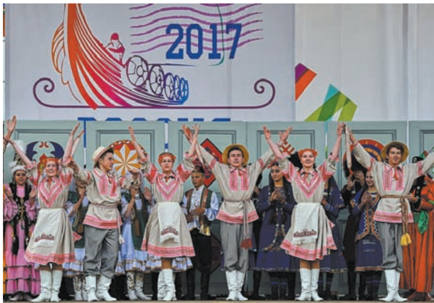
На площади Победы состоялся великолепный концерт

Больше фото в группе «Маяк» «В контакте» vk.com/mayaksbor и на сайте mayaksbor.ru