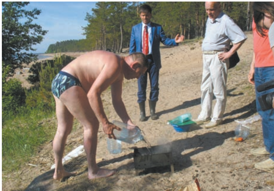
Рейд администрации в Липово прошлым летом