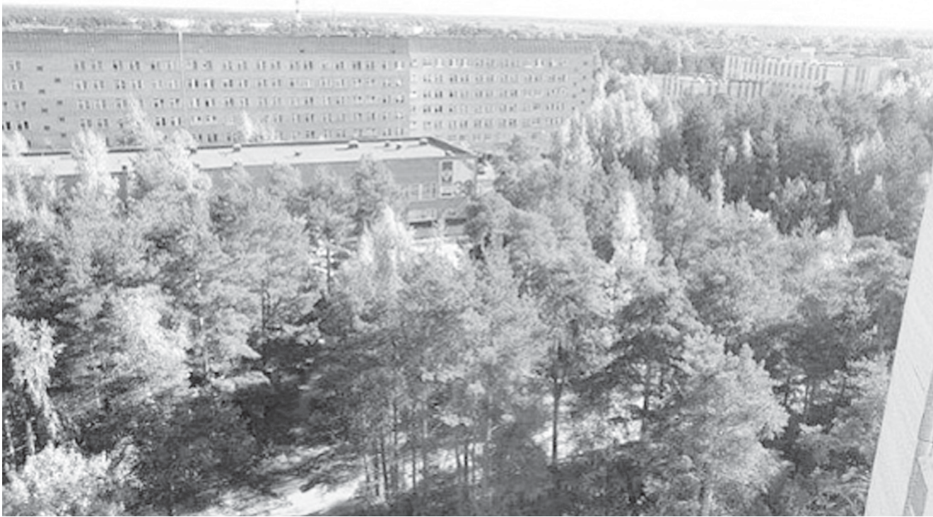
Сосновоборская медсанчасть, работающая под эгидой ФМБА — единственная в Сосновом Бору организация государственной системы здравоохранения

Сосновоборская медсанчасть, работающая под эгидой ФМБА — единственная в Сосновом Бору организация государственной системы здравоохранения. К ней прикреплены 67720 жителей города, в том числе 12516 детей.