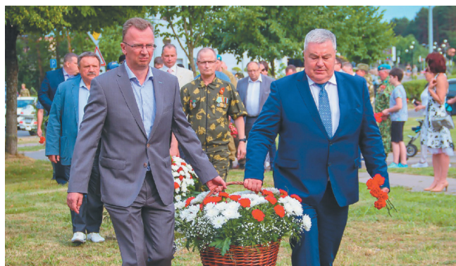
Поздравить с Днем ветеранов локальных войн и почтить память тех, кто в свое время так и не вернулся домой, пришли почетные гости

Наши соотечественники мира, защищая подвергались в десятках стран шиеся агрессии страны.