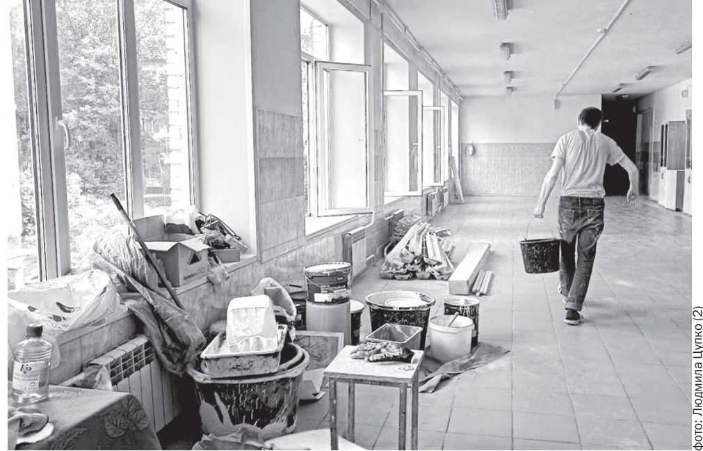
фото: Людмила Цупко (2)

Школа № 3 была одним из пунктов проведения ЕГЭ, поэтому ремонт здесь начался только 29 июня. Компания «РемЕвроСтрой» ремонтирует четыре классных комнаты: два кабинета начальной школы, а также кабинеты русского языка и информатики. В помещениях будут полностью обновлены инженерные сети, стены, потолок и пол, частично заменена мебель. По плану работы