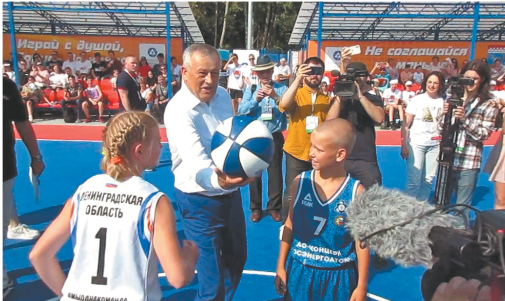
Губернатор Александр Дрозденко вбрасывает первый мяч

Торжественно открывали новый объект губернатор Ленобласти Алек-