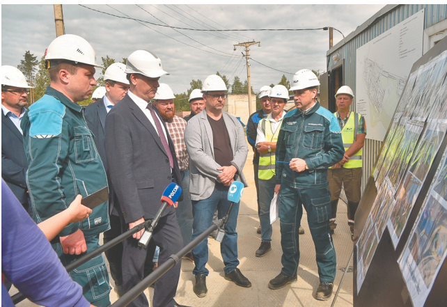
Губернатор Андрей Травников провёл выездное совещание на стройплощадке ФДРЦ

телями, 800 рабочих мест, новые компетенции, новые специалисты, которые в Новосибирской области, может быть, раньше никогда не было — объект важнейший.