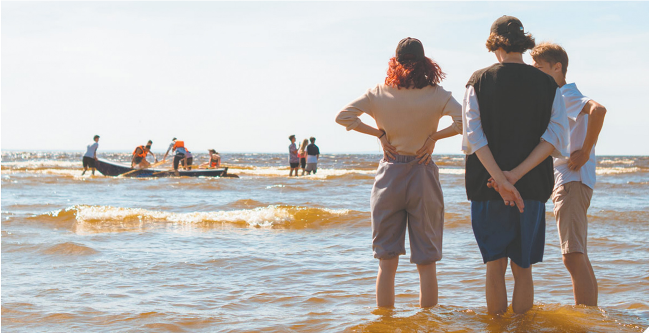
фото: Людмила Цупко (4)

Поддержку в этом деле «Диалогу» оказали давние друзья — клуб детского и юношеского