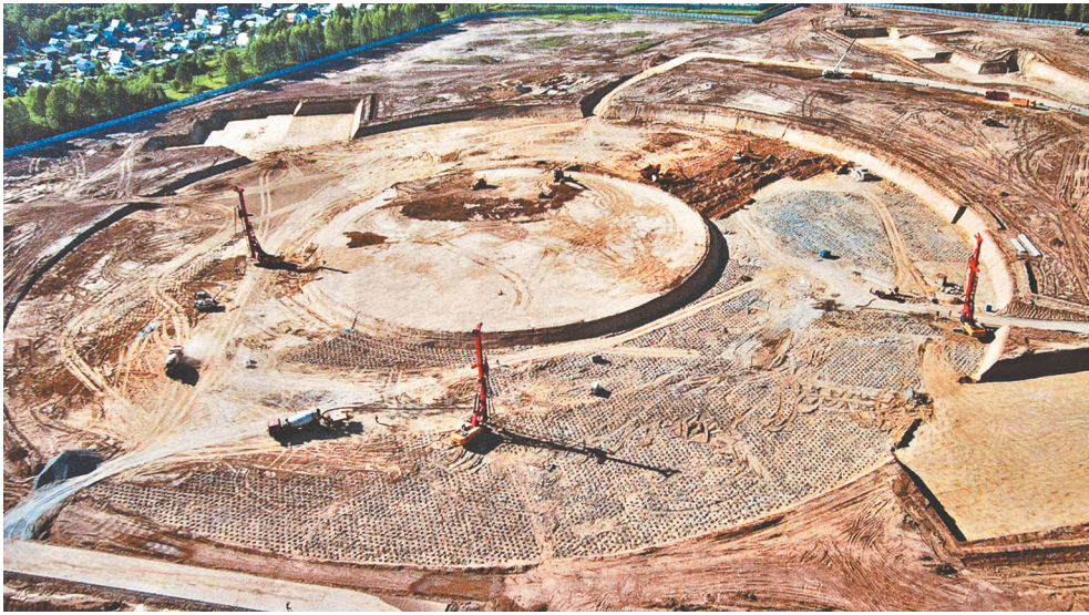
Работы на стройке ЦКП «СКИФ» сегодня идут в соответствии с графиком, более того, по зданию накопителя строители опережают график на 60 дней

— Новосибирск — общепризнанный многофункциональный медицинский и логистический центр Сибири. Мои коллеги из Минстроя региона, территориального Управления Росмушкетства, органы местного самоуправления нашли достаточно оперативно территорию для строительства такого нужного для нашего региона и всей Сибири объекта, — отметил Андрей Травников. — Сегодня здесь вовсю кипит работа. Подрядчик демонстрирует четкую организацию работ, высокую квалификацию и опыт. И подтверждает: летом 2024 года центр уже заработает. Это 300 круглосуточно действующих, уникальных реабилитационных мест для проживания детей с особенностями развития, вместе с роди-