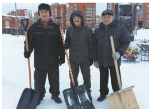
□ Соб. инф.

...Все лучше и эффективней, чем злиться на неблагодарные участки, с трудом пробираясь по ним.