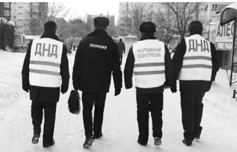
Если есть желание вступить в дружину, обращайтесь в ГИБДД

трены стоячие места в автобусе, то ехать стоя можно. В сосновоборских маршрутных автобусах в среднем — 25 сидячих и 18 стоячих пассажирских мест.