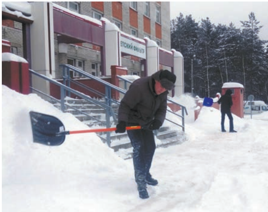
Если чернобыльцы (на фото внизу) заранее приглашали сосновоборцев на акцию, то благотворительное общество «Дела милосердия» кинуло клич в соцсетях буквально накануне (фото сверху)

Если чернобыльцы заранее приглашали сосновоборцев на акцию, то благотворительное общество «Дела милосердия» кинуло клич в соцсетях буквально накануне. Организаторы предполагали, что террито-