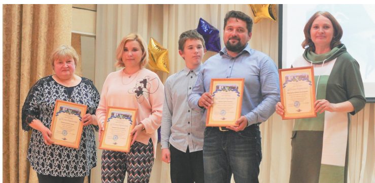
За личный вклад в развитие юных спортсменов наградили педагогов ДЮСШ и «Ювенты»

нировал школьные баскетбольные команды. Под его руководством девушки-баскетболистки показывали отличные результаты на внутригородских соревнованиях,