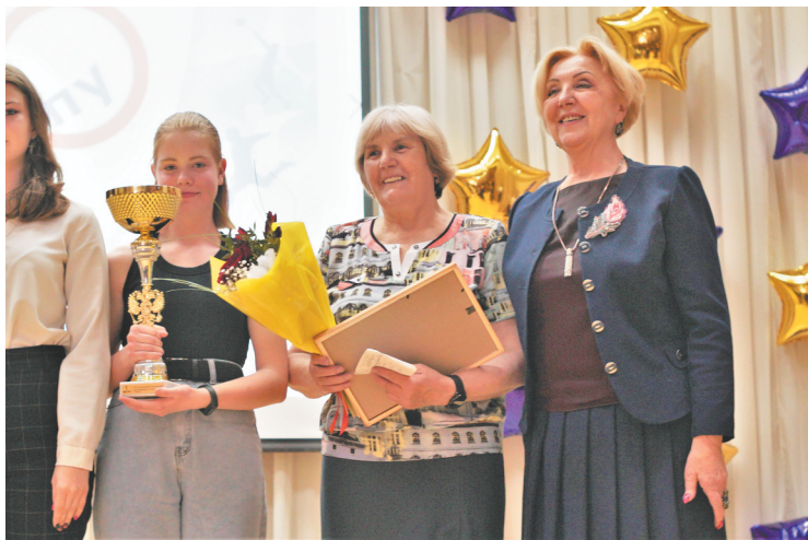
Больше всего спортивных кубков по итогам 2021/2022 года собрала школа №9.