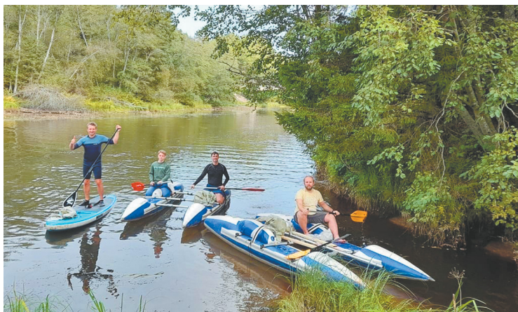
У «Ювенты» и «Формулы воды» на этот летний сезон большие планы для занятий с детьми