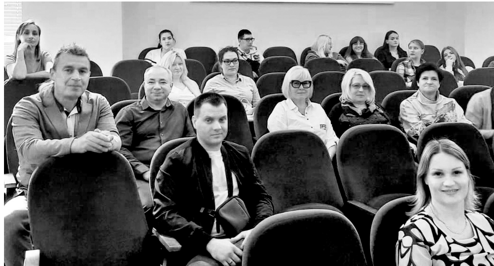
«Предприниматели — смелые и самостоятельные люди, они способны брать судьбу в свои руки»

Вместе с коллегами из областного Фонда поддержки предпринимательства и промышленности она представила