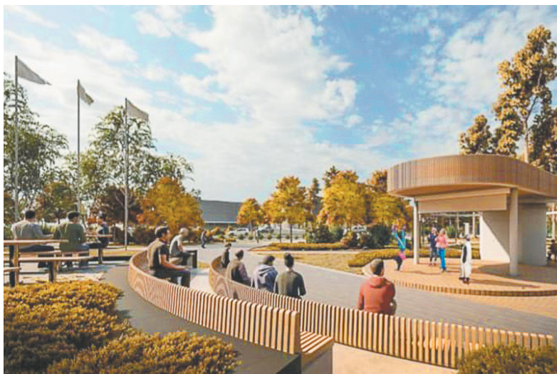
Проект событийной площадки со сценой и амфитеатром

5 проектов благоустройства в малых городах и исторических поселениях Ленинградской области направят от региона на XI Всероссийский конкурс комфортной городской среды, сообщил губернатор Ленинградской области Александр Дрозденко. В числе этих проектов — и масштабное благоустройство в районе Дворца культуры «Строитель» и ДЮСШ в центре Соснового Бора.