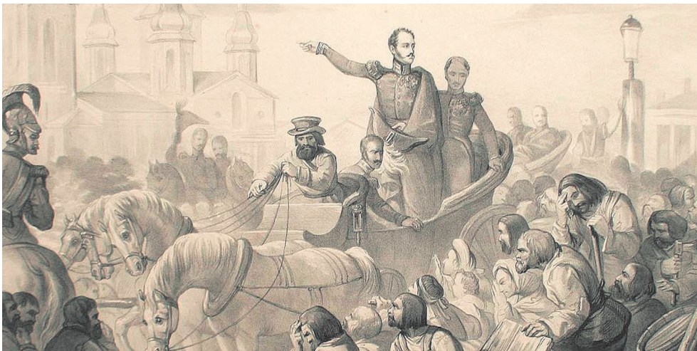
Холерный бунт 1831 года. Николай I умиряет толпу на Сенной площади

В настоящее время особое внимание санитарно-эпидемиологической обстановке уделяется регионам, граничащим с территориями Украины и самопровозглашённых республик ЛНР и ДНР, Ростовская, Курская, Белгородская, Воронежская, Брянская области, Краснодарский край, Крым, Севастополь. Последствия гуманитарного кризиса: разрушение систем водоснабжения и санитарии или перемещение на-