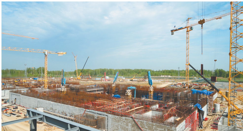
Уже завершается возведение стен до нулевой отметки, полным ходом идет армирование и бетонирование перекрытий

Планируется в июне-июле выполнить обратную засыпку — закрыть