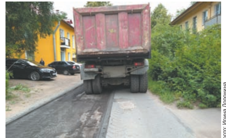
Фреза работает быстро, но мешают припаркованные машины

Жителей первого и второго микрорайонов в очередной раз убедительно просят обращать внимание на объявления и вовремя убирать транспорт с проезжей части.