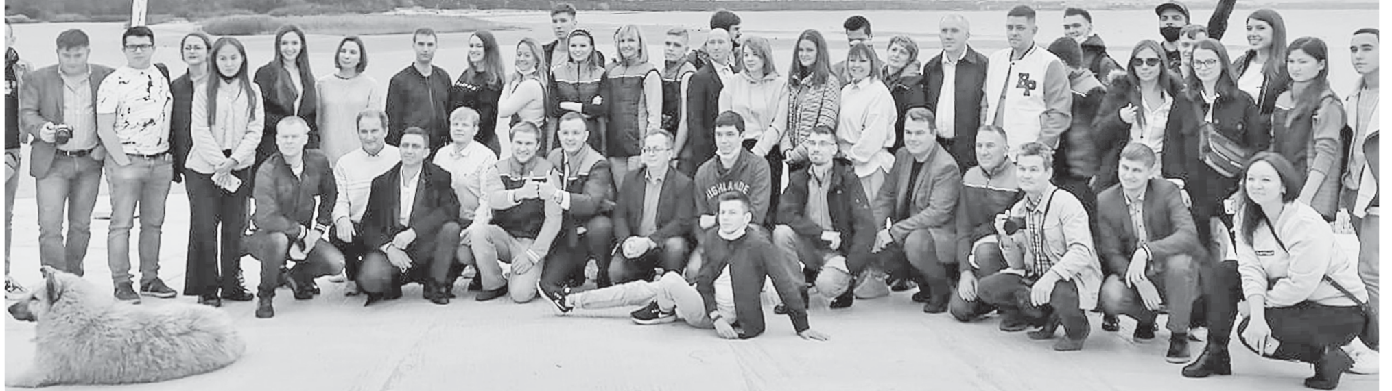
Самая большая делегация, 50 участников конкурса из 8 регионов страны, съехалась в Сосновый Бор

75 ЛЕТ АТОМНОЙ ПРОМЫШЛЕННОСТИ ОПЕРЕЖАЯ ВРЕМЯ