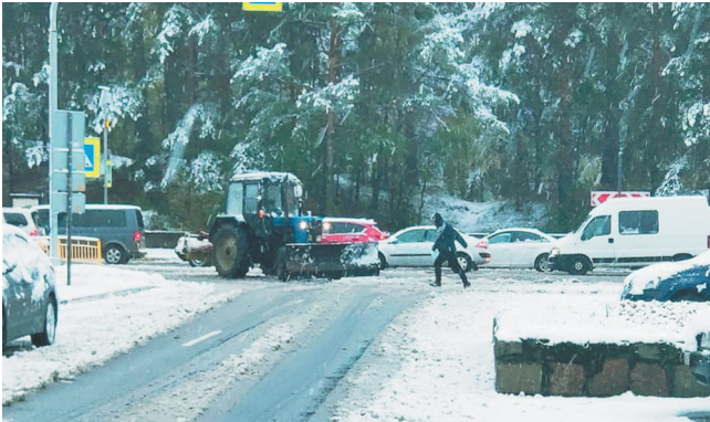
К 11 часам основные дороги были очищены от снега