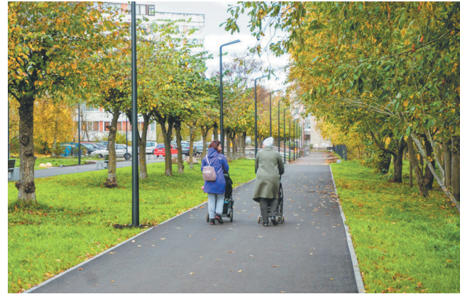
Прогулочная зона у школы № 6 ожидает завершения

Ожидает завершения и прогулочная зона у школы № 6. Там до сих пор не установлены камеры видеонаблюдения и не закончены работы