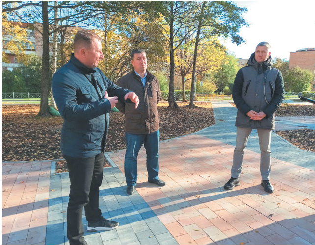
Глава Соснового Бора обратил внимание, что в целом этот проект можно считать успешным

Глава Соснового Бора обратил внимание, что в целом этот проект можно считать успешным: помимо приведения в порядок самой территории сквера, была расширена парковка у художе-