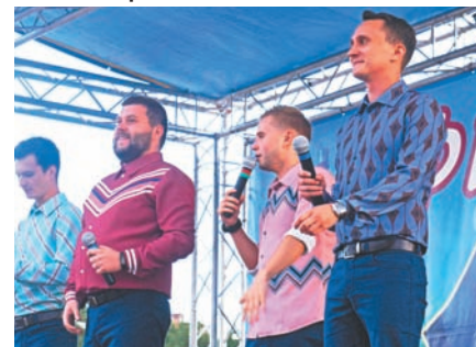
Хэдлайнеры фестиваля, игроки Высшей Лиги команда «НАТЕ», показали, что значит качественное выступление