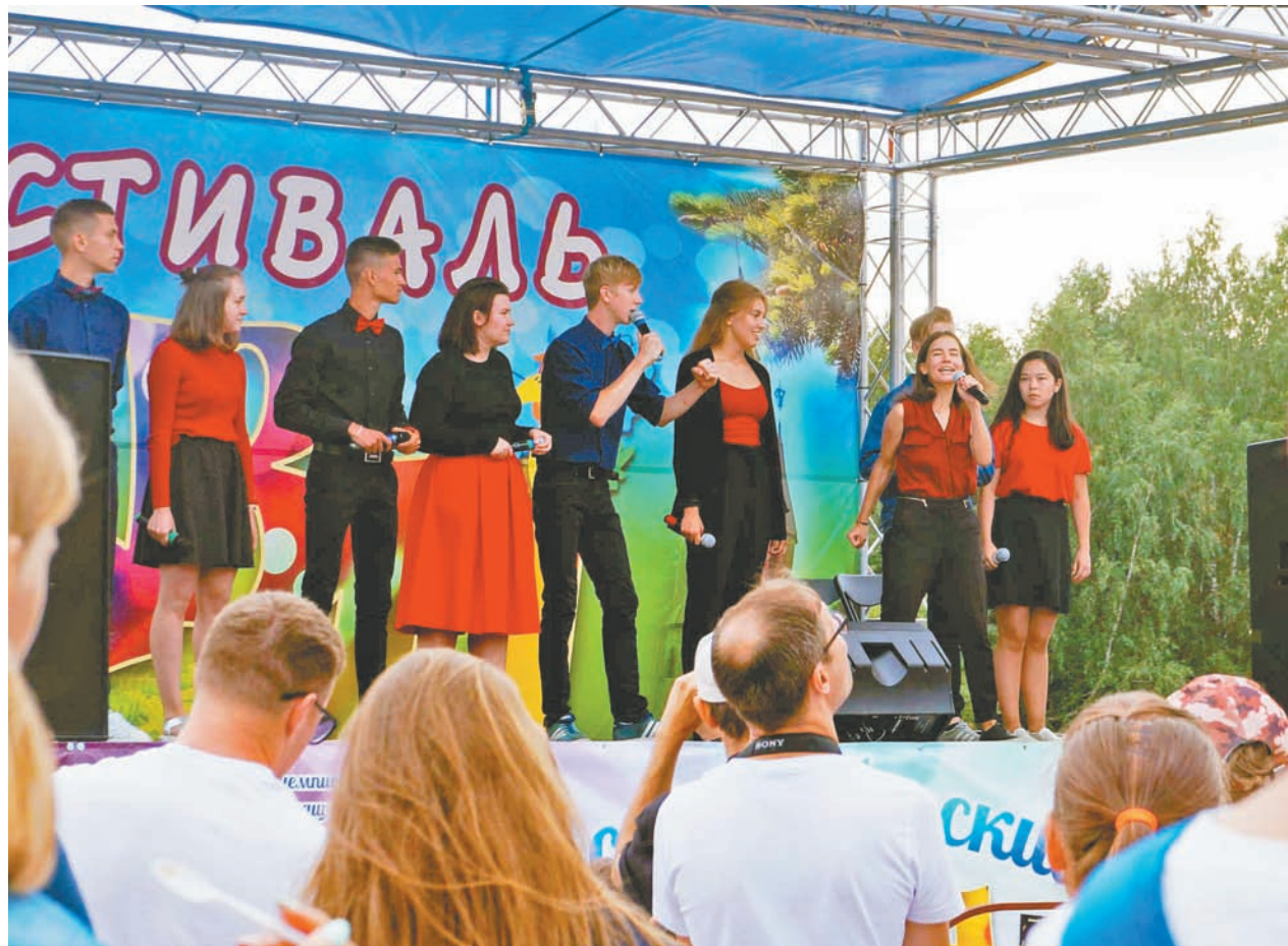
фото: Людмила Цупко (4)

Повлияло ли отсутствие соревновательного элемента или же просто атмосфера на фестивале располагала, но выступили команды бойко и с огнём. Шутили