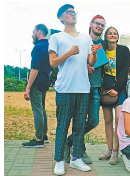
За кулисами команды с радостью желающими

Завершился чемпионат города по соккеру среди мужских