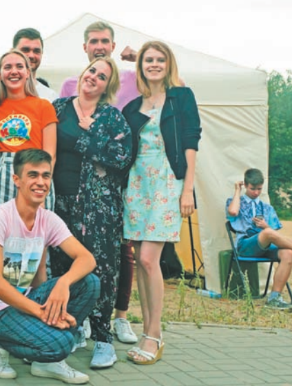
фотографировались со всеми

и живой пример других выступлений для этого действительно важен. Как отметили участницы команды «От кутюр», то, что на фестиваль пригласили «Высшую Лигу» — это очень хорошо. По их словам, для местных это — как открытый урок, и дело не столько в самих шутках, сколько в их подаче, актерской игре. Ребята из молодежной сборной Соснового Бора тоже оценили уровень фестиваля: для них, как для молодых КВНщиков, это была возможность увидеть, через какие этапы им предстоит пройти как команде. Так или иначе, но все участники сосновоборского фестиваля выступили весьма достойно — зрители всех возрастов искренне хохотали и аплодировали всем без исключения.