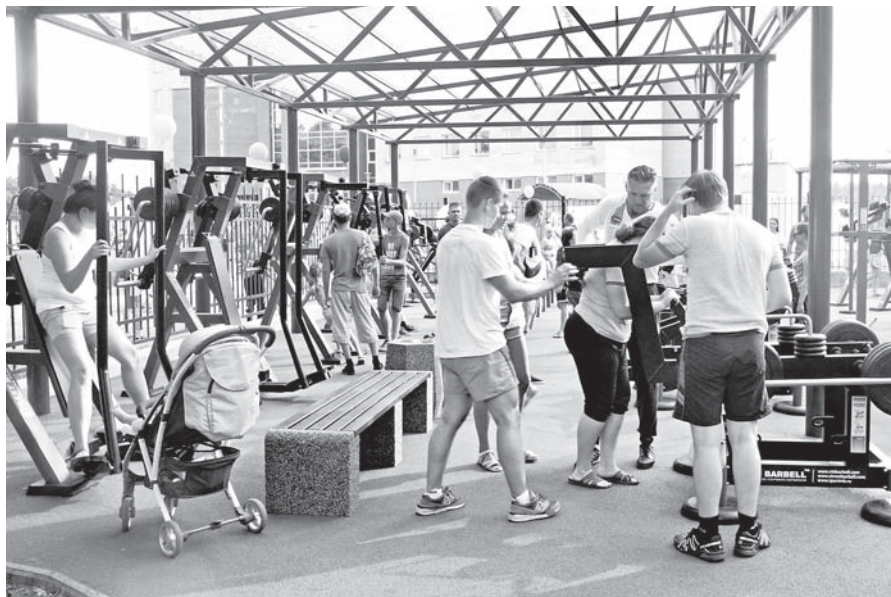
фото: Людмила Цупко (6)

Уже в день открытия все желающие могли опробовать