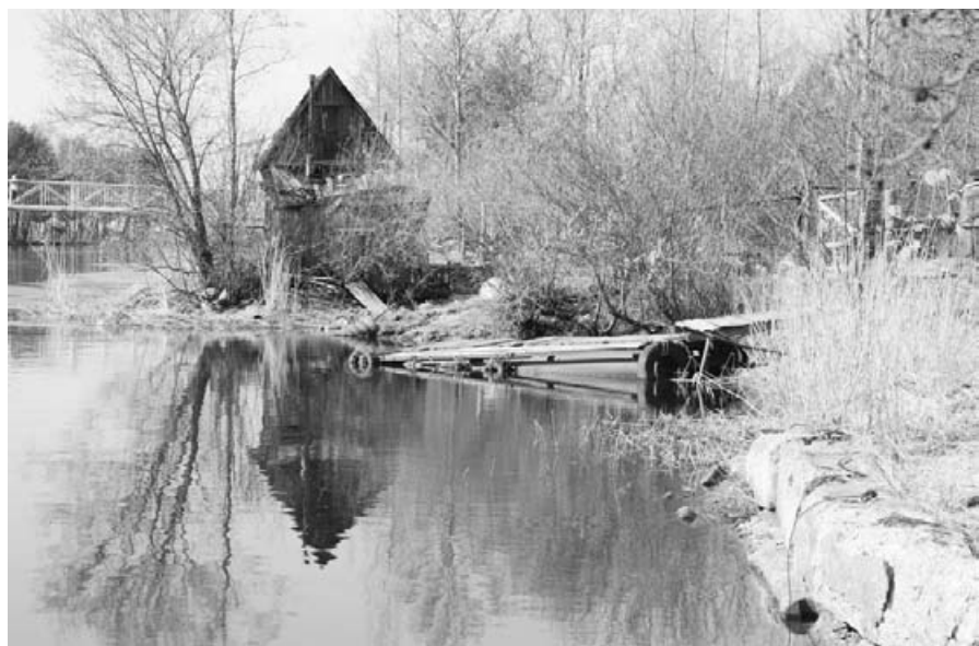
В 2012 году, домик по требованию прокуратуры был снесен, бывший работник станции, а позднее — лодочник — выселен