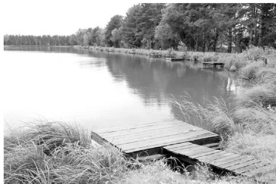
Озабоченность вызывает не столько угроза потерять место отдыха на природе, сколько то, что пруд — уникальный живой уголок