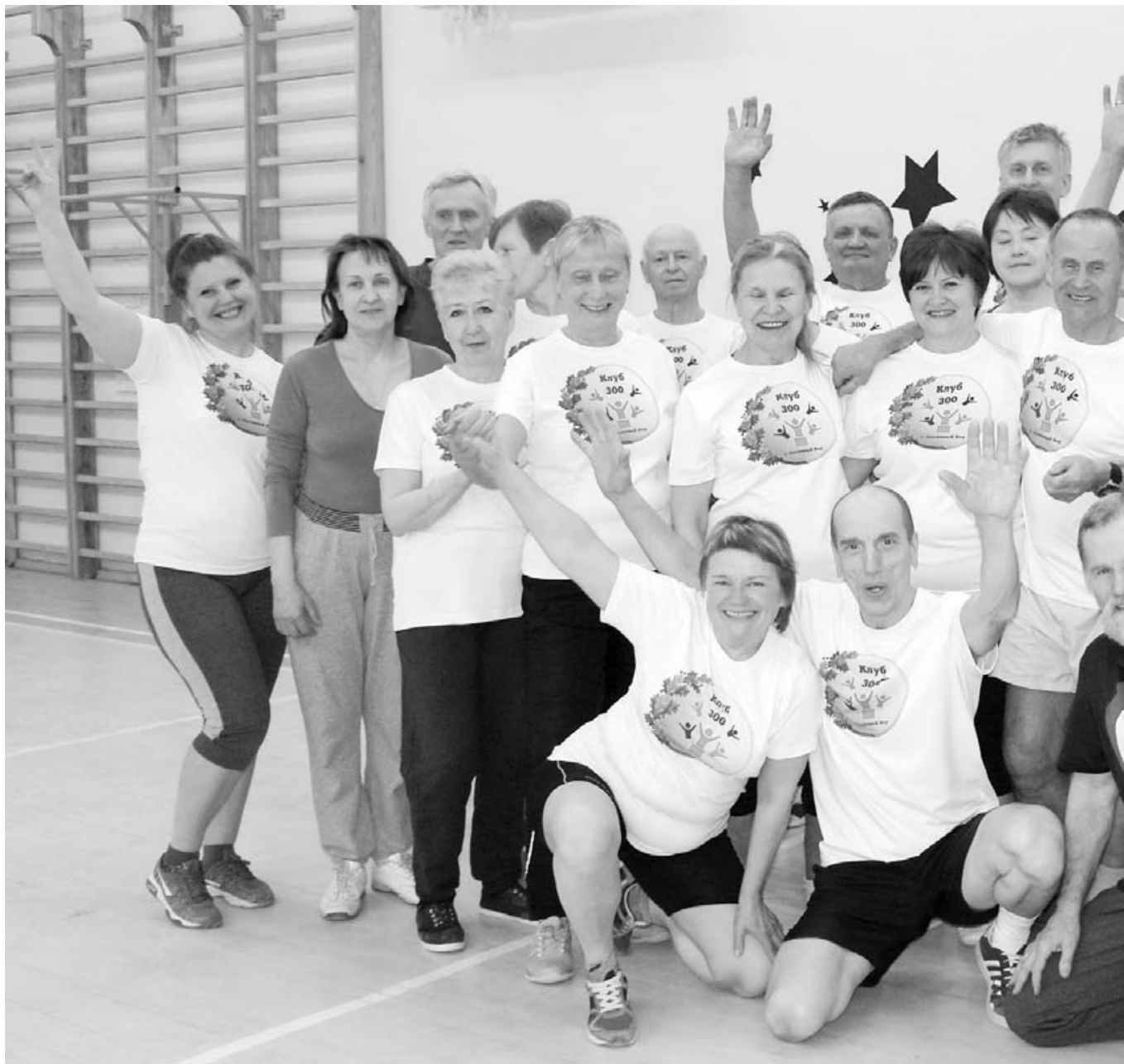
Члены «Клуба 300» перед тренировкой

А еще раньше, до этого, я читал о людях, которые, получив на войне тяжелые ранения или болезни, затем буквально силой воли восстанавливали свое здоровье. И даже становились большими спортсменами. Как, например, знаменитый гимнаст Борис Чукарин, который стал олимпийским чемпионом. Или как Сытин, который само-внушением вылечил себя от безнадежных (как констатировали врачи) ран.