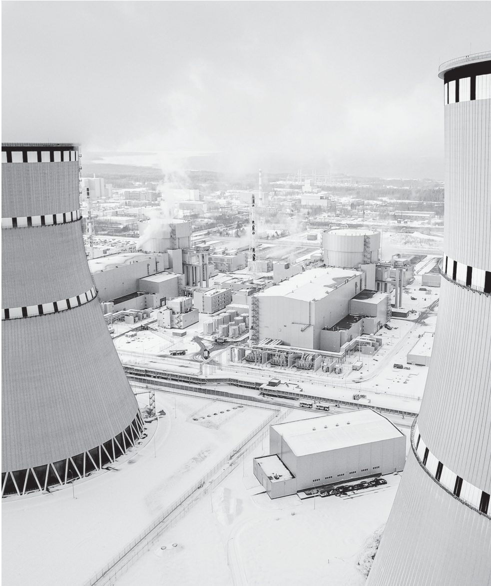
На Ленинградской АЭС идет завершение строительства шестого энергоблока и опытно-промышленная эксплуатация. В марте этого года состоится его передача в промышленную эксплуатацию

На Ленинградской АЭС идет завершение строительства шестого энергоблока и опытно-промышленная эксплуатация. В марте этого года состоится его передача в промышленную эксплуатацию. На Курской АЭС-2 все запланированные работы сделали, смонтировали каркас здания турбины первого энергоблока, начали строительство градирни. В проекте «Прорыв» в Северске приступили к сооружению всех вспомогательных объектов.