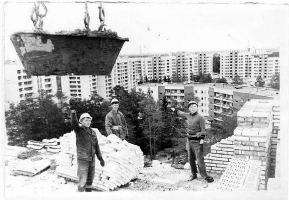
Строится дом по проспекту Героев, 31