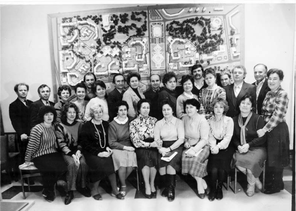
Коллектив УКСа середины 80-х. На заднем плане — макет города. Как видно, не все задумки воплощены