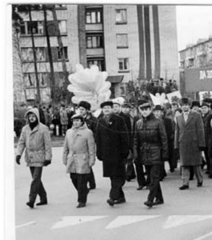
День 7 ноября ноября — красный