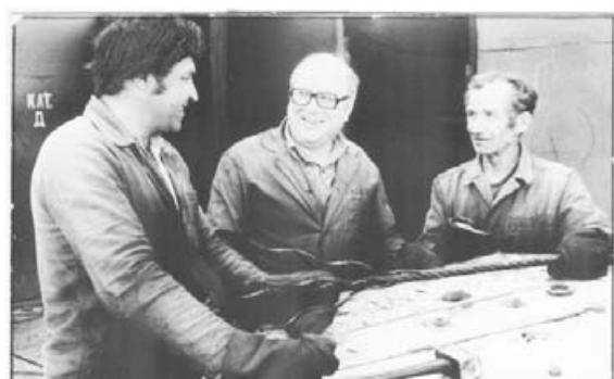
УПП, участок механической обработки