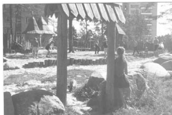
В Малой Копорской крепости