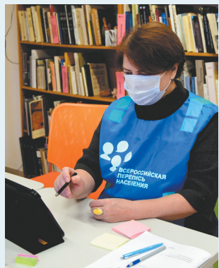
Участие в переписи через портал — это удобно

В самой процедуре переписи также предусмотрены цифровые возможности. На «Госуслугах» можно переписаться, получив QR-код.