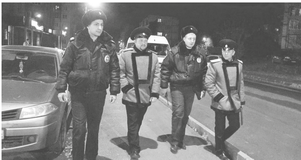
Выборгские казаки во время рейда

Казачество готово активнее участвовать в обеспечении общественного порядка в регионе.