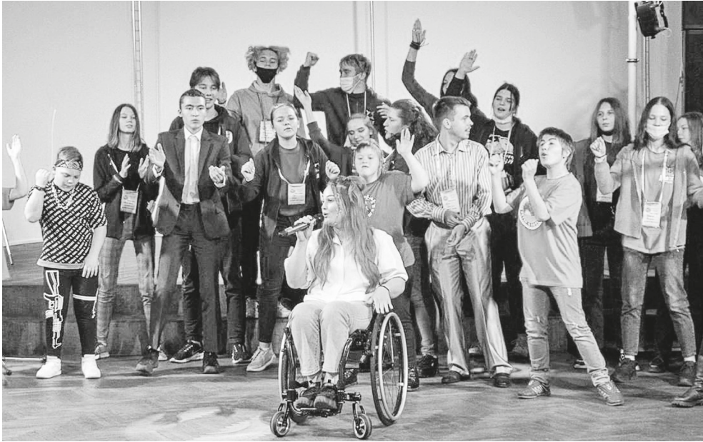
Участники фестиваля — все разные: и по внешности, и по возрасту, и по крепости тела. Но в дни фестиваля они все равны, объединенные настоящей суперсилой — любовью к сцене