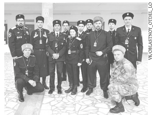
Казаки из Ленобласти на II Всероссийском слете казачьей молодежи в Красноярске