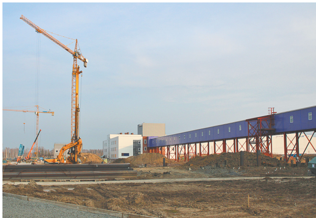
Стометровый переход соединит входную группу с основной частью модуля

работает порядка 400 человек. Это монтажные организации «Деталь Проект», «Реформа», «СЭМ» и др. По проекту модуль должен быть сдан в промышленную эксплуатацию раньше реактора — к концу будущего года.