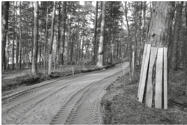
При строительстве велодорожки деревья постарались защитить