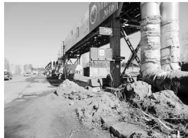
3. Далее идет небольшой, но труднопреодолимый участок вдоль шоссе. Сейчас на нем в дополнение всему еще и ведутся работы, он весь перерыл.