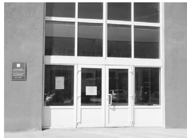
6. И вот она — цель: вход МФЦ. Неудивительно, что получатели соцслужб предпочитают идти за справками в комитет соцзащиты в мэрию, а не в МФЦ.