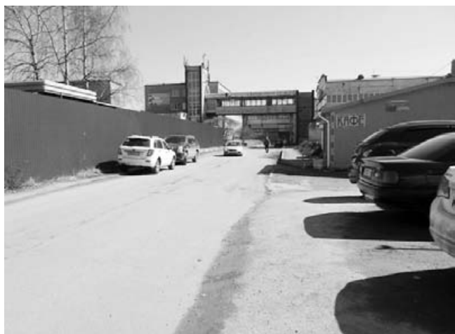
4. Далее, поворот направо — и снова пыльная неровная дорога без тротуара.