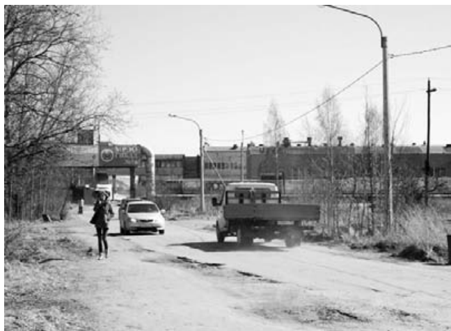
1. Сначала дорога к МФЦ идет вдоль разбитого выезда из Заречья.