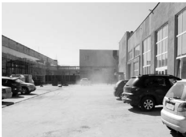
5. Еще один поворот — и пыльная, в ямах и ухабах, площадка в промзоне, на которой, лавируя между машинами, среди окружающих зданий еще нужно найти МФЦ.