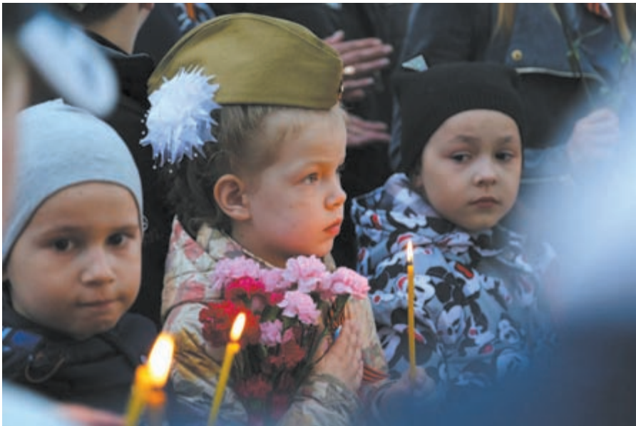
фото: Юрий Шестернин, Александр Варламов