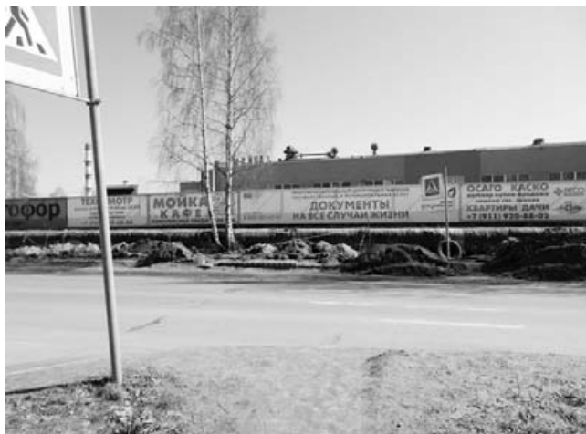
2. Затем идут рискованные для пешеходов подходы к переходу через оживленное Копорское шоссе. Разметка перехода едва видна, никаких «лежачих полицейских» нет.