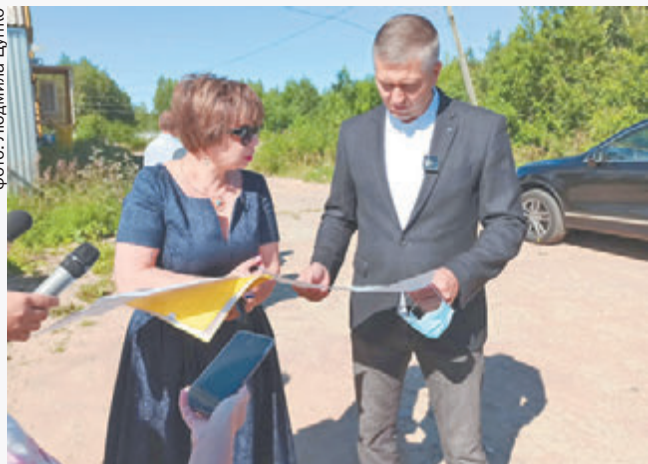
Глава города заявил, что к мнению местных жителей необходимо прислушаться

До сих пор нет окончательного проекта велодорожки, так как не решено окончательно, где именно она будет пролегать. Влияет на это множество факторов: собственная заболоченность, наличие существующих построек (домов, частных участков), коммуникаций