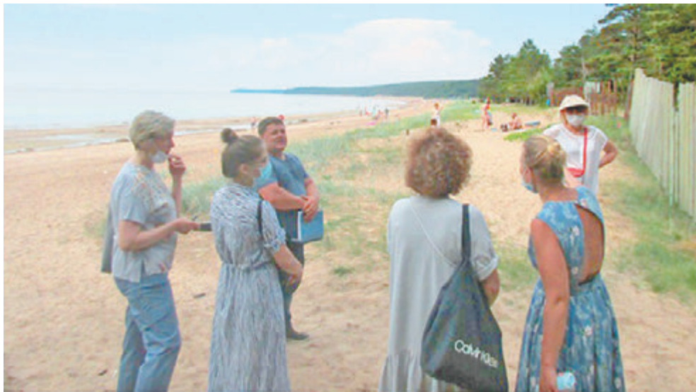
Никто не отрицает нужность велодорожки. Но есть проблемные моменты

Первый — о наличии полной проектной документации и точной трассировки дорожки в ней, а также о соблюдении всех необходимых законов (в частности — о наличии согласования строительства в прибрежной зоне с Невско-Ладожской инспекцией). Напомним, вопрос о проекте звучал уже не раз, но пока инициаторы проекта (ассоциация «Граждане города Сосновый Бор») так и не представили горожанам в публичном пространстве хотя бы приблизительную схему трассировки будущей велодорожки. Следующее, что отметил автор — не стоит совмещать место для отдыха и место для передвижения. А велодорожка — это для многих жителей, прежде всего, — возможность добраться до места: Ручьев, Липово или пляжа. При этом вдоль шоссе все равно необходимо делать пешеходную дорожку, которую логично было бы провести параллельно с велодорожкой. Он обратил внимание на экологический аспект: дорожку планируют вести через болото и ручьи,