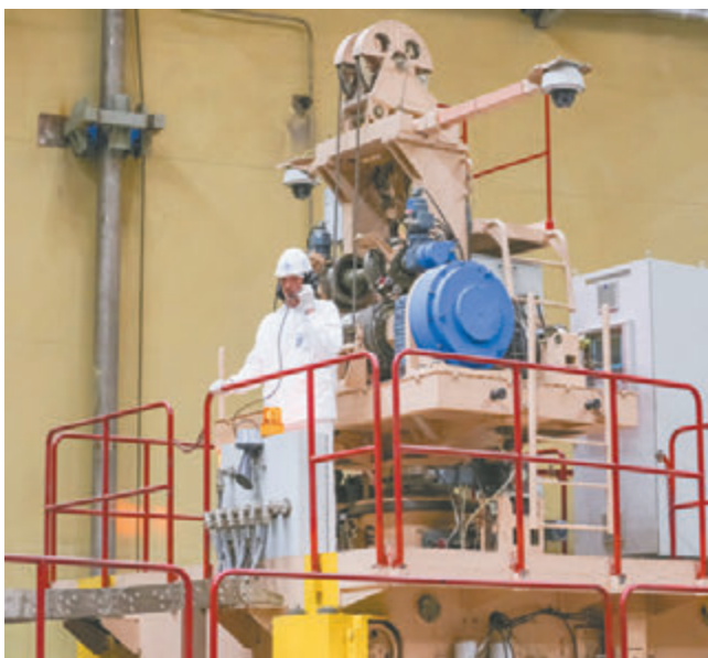
Фото: департамент коммуникаций Концерна «Росэнергоатом» (4)

«Начало операций по физическому пуску фактически означает, что все работы, связанные с сооружением блока, закончены. Сегодня это са-