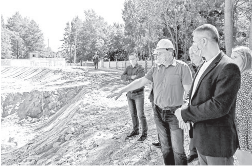
Представители администрации остались довольны тем, какими темпами идет стройка

Представители администрации остались довольны тем, какими темпами