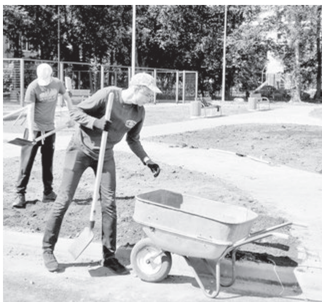
Остались работы по благоустройству, которые выполняют трудовые отряды

Порядок почти как в школе — 45 минут работы и 15 — на отдых. В общей сложности, за одну смену ребята успева-